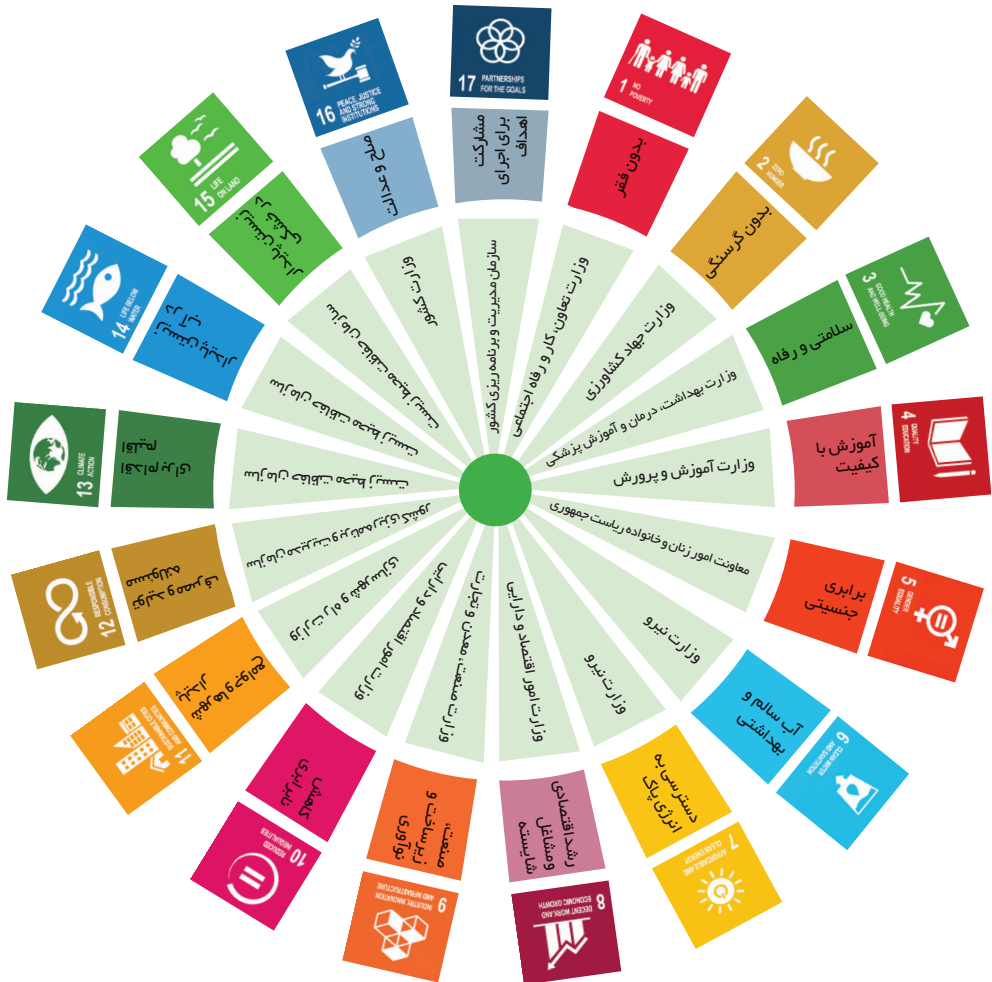
نمودار ۱: متولیان اصلی ۱۷ هدف کلان توسعه پایدار در سطح ملی

کمیته ملی توسعه پایدار وظیفه هماهنگی و نظارت بر چگونگی دستیابی به اهداف را بر عهده دارد. این کتاب، چشم انداز و برنامه توسعه پایدار ۱۵ سال آتی برای جهان است و فرصتی است که با توجه به اولویت های ملی، توسعه ای متوازن، هماهنگ و پایدار را برای کشور عزیزمان رقم بزنیم. بر اساس تصمیمات کمیته ملی توسعه پایدار، متولیان اصلی اجرای اهداف توسعه پایدار در نمودار شماره ۱ و همچنین دستگاه های همکار نیز در جدول شماره ۱ مشخص گردیده است.